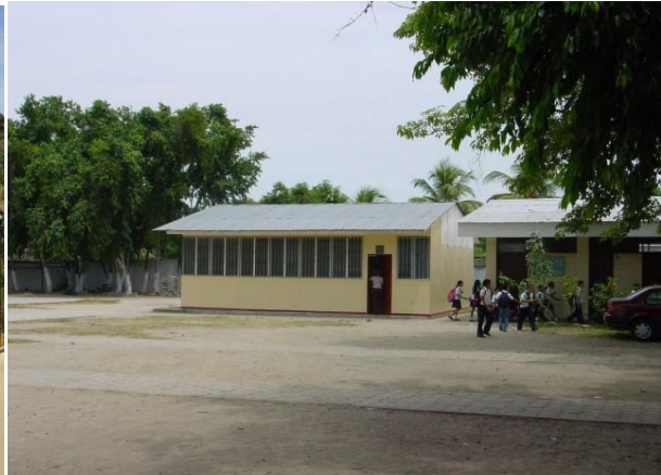
2 class rooms in San Pedro Sula, Honduras in 2002, na de hurricane Mitch

Het Foldex Bouw Systeem bestaat uit prefab bouwpanelen, die in Nederland vervaardigd worden.